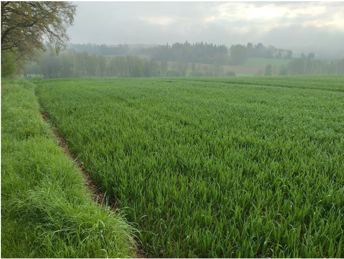
Abbildung 10: FI-Nr. 287 – Blick von Südwest über das Winterweizenfeld ins Tal des Mooswiesengrabens am 3.5.2023