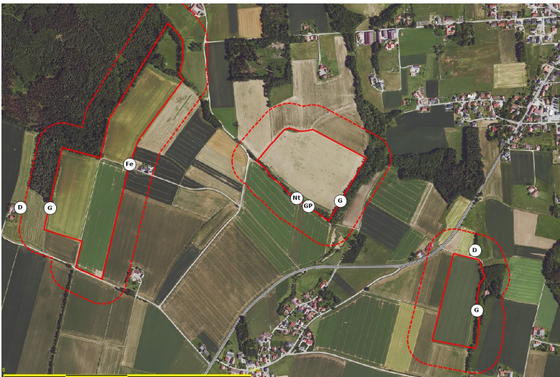
Abbildung 13: Lage der Revierzentren von weiteren planungsrelevanten Arten: Dorngrasmücke (D), Feldsperling, Goldammer (G), Gelbspötter (Gp) und Neuntöter (Nt); rot durchgezogen: Grenzen der geplanten Solarparks, rot gestrichelte Linie: 100-Meter-Puffer. Hintergrund Quelle: https://geoportal.bayern.de/bayernatlas/

Durch das Vorhaben könnten jedoch für an Hecken und kräuterreiche Säume gebundene Arten, wie Goldammer, Dorngrasmücke, Neuntöter, und Feldsperling, wertvolle Habitatstrukturen zusätzlich geschaffen werden. Auch für das im Untersuchungsbereich nicht mehr festgestellte Rebhuhn könnten durch das Vorhaben passende Habitatstrukturen geschaffen werden.