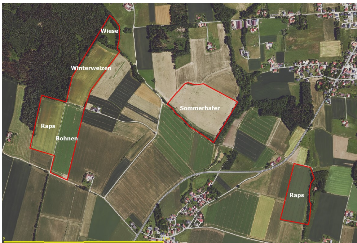
Abbildung 2: 2023 im Bereich der geplanten Solarparks angebaute Feldfrüchte, rote Linien: Flächen der geplanten Solarparks, Hintergrund Quelle: https://geoportal.bayern.de/bayernatlas/ )

Der Bereich liegt unmittelbar nördlich des Hangwaldes entlang der Isarleite. Nach Westen ist er durch Auwälder der Isar und nach Osten durch die Siedlung Alttiefenweg weiter eingengt (Abb. 14 und 15). Im Zentrum findet sich auch ein kleines Feldgehölz unmittelbar südlich von FI-Nr. 1070 (Abb. 2).