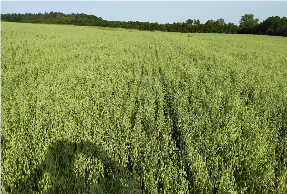
Abbildung 3: FI-Nr. 192 - Blick von Südwest nach Südost über Sommerhafer mit zahlreichen Disteln und bodendeckenden Kräutern am 20.6.2023