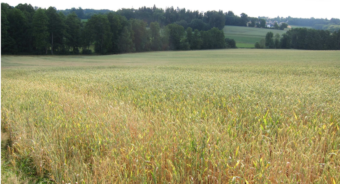
Abbildung 11: FI-Nr. 287 – Blick von Südwest über das Winterweizenfeld ins Tal des Mooswiesengrabens am 28.6.2023