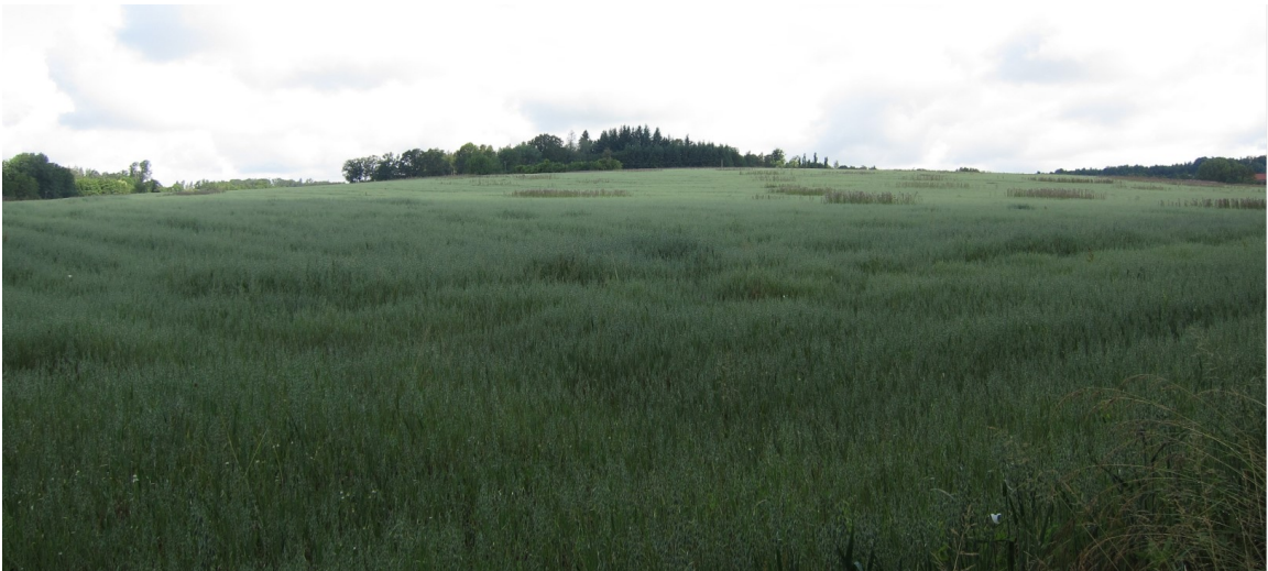
Abbildung 4: FI-Nr. 192 – Über den Sommerhafer hinaus wachsende Distelgruppen am 28.6.2023