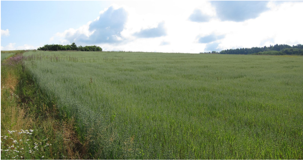
Abbildung 5: FI-Nr. 192 - Blick von Südwest nach Nordost über Sommerhafer mit zahlreichen Disteln und bodendeckenden Kräutern und kräuterreicher Ruderalvegetation entlang des Mooswiesengrabens nordwestlich von FI-Nr. 192 am 28.6.2023