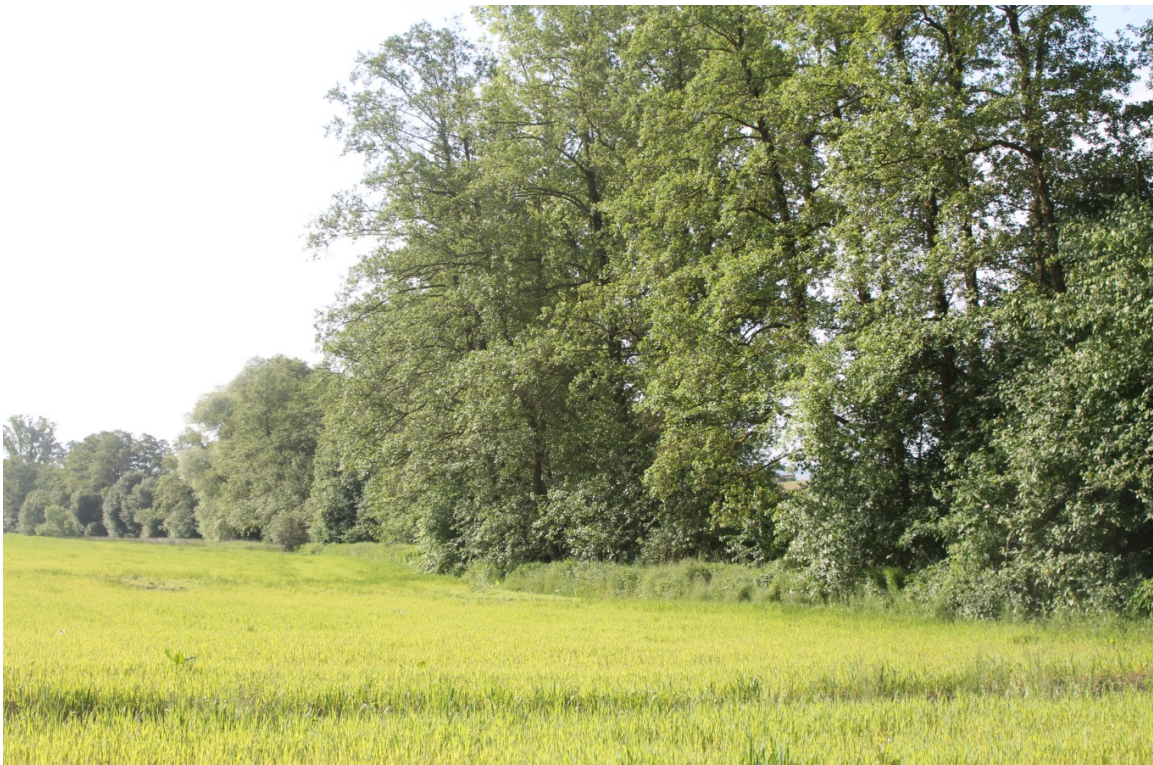
Abbildung 6: FI-Nr. 192 – Dichter Galeriewald entlang des Mooswiesengrabens südwestlich von FI-Nr. 192 am 20.6.2023