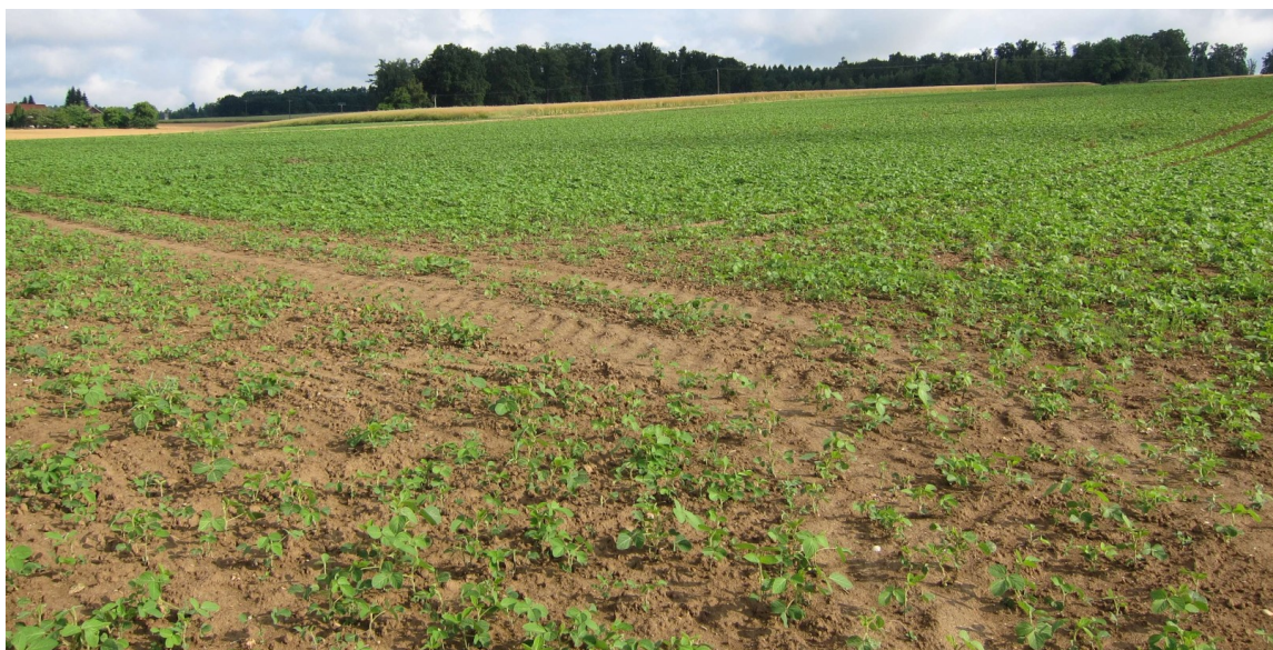
Abbildung 8: FI-Nr. 264 und 357 – Blick von Südost über das Bohnenfeld in FI-Nr. 264 zum Rapsfeld in FI-Nr. 357, welches sich im Osten und Norden bis zum Waldrand des Gscheidmaierholzes erstreckt, am 28.6.2023