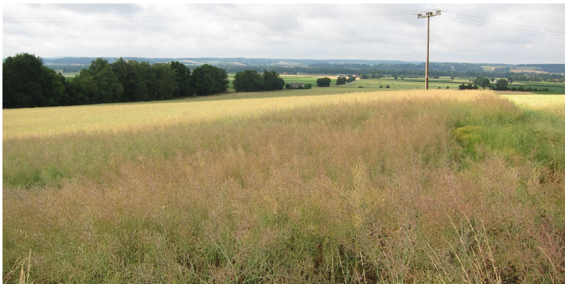
Abbildung 7: FI-Nr. 246 – Blick von Nord über das Rapsfeld am 28.6.2023. Links im Bild der Galeriewald entlang des Feldgrabens am östlichen Rand von FI-Nr. 246