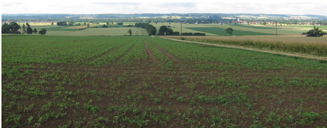
Abbildung 9: FI-Nr. 264 – Blick von Nord über das Bohnenfeld am 28.6.2023. Links im Bild das Rapsfeld auf FI-Nr. 357