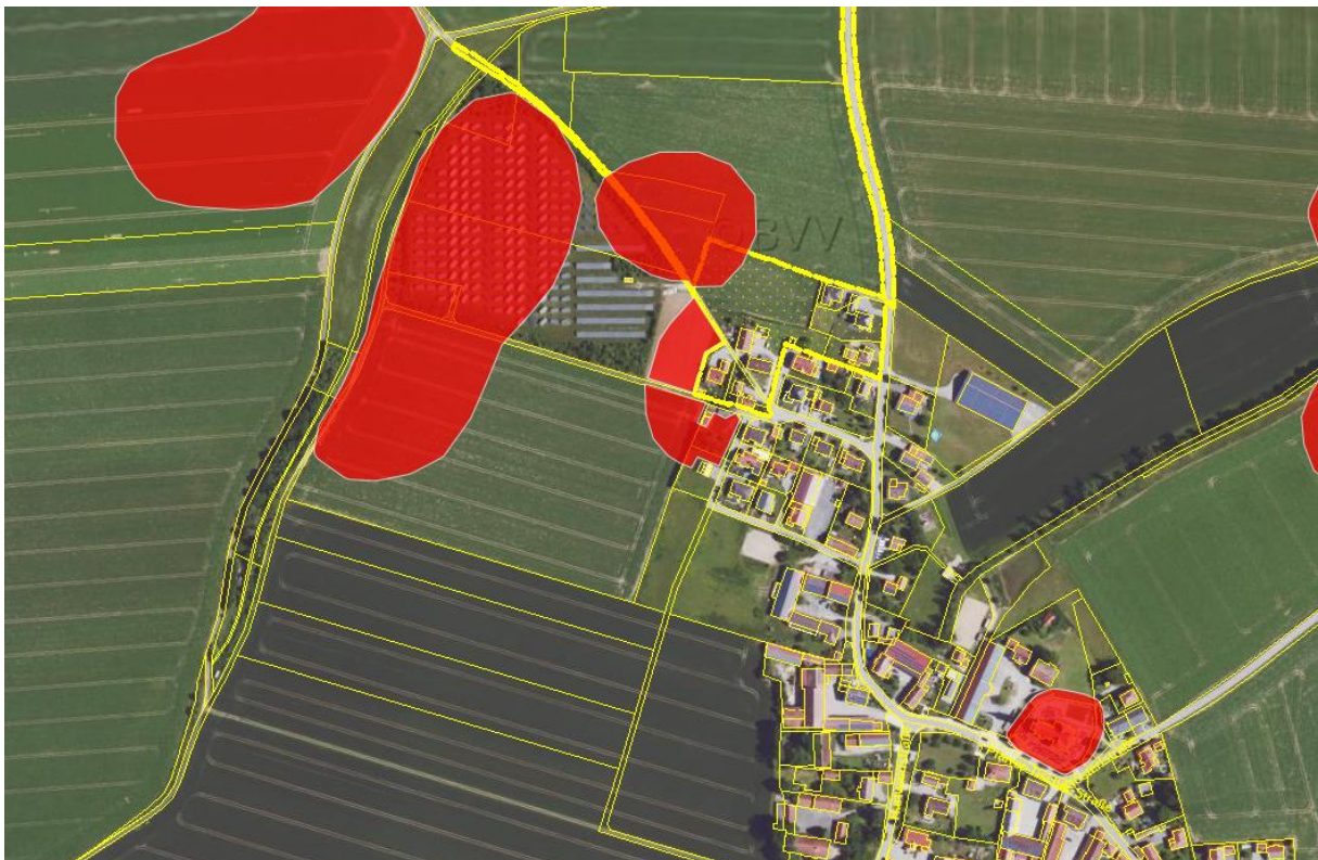
Abbildung 2: Ausschnitt Denkmal-Viewer Bayern

Im Denkmalviewer Bayern sind Hinweise auf Boden- oder Baudenkmäler im näheren Umgriff zu den Ergänzungsbereichen vorhanden.