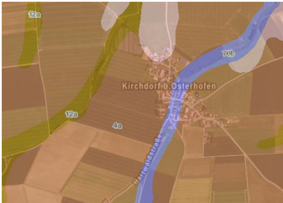
Abbildung 3: Ausschnitt Übersichtsbodenkarten von Bayern

Innerhalb des Ergänzungsbereiches kommt überwiegend Parabraunerde und verbreitet Braunerde aus Schluff bis Schluffton [Lösslehm] über Carbonatschluff [Löss] vor.