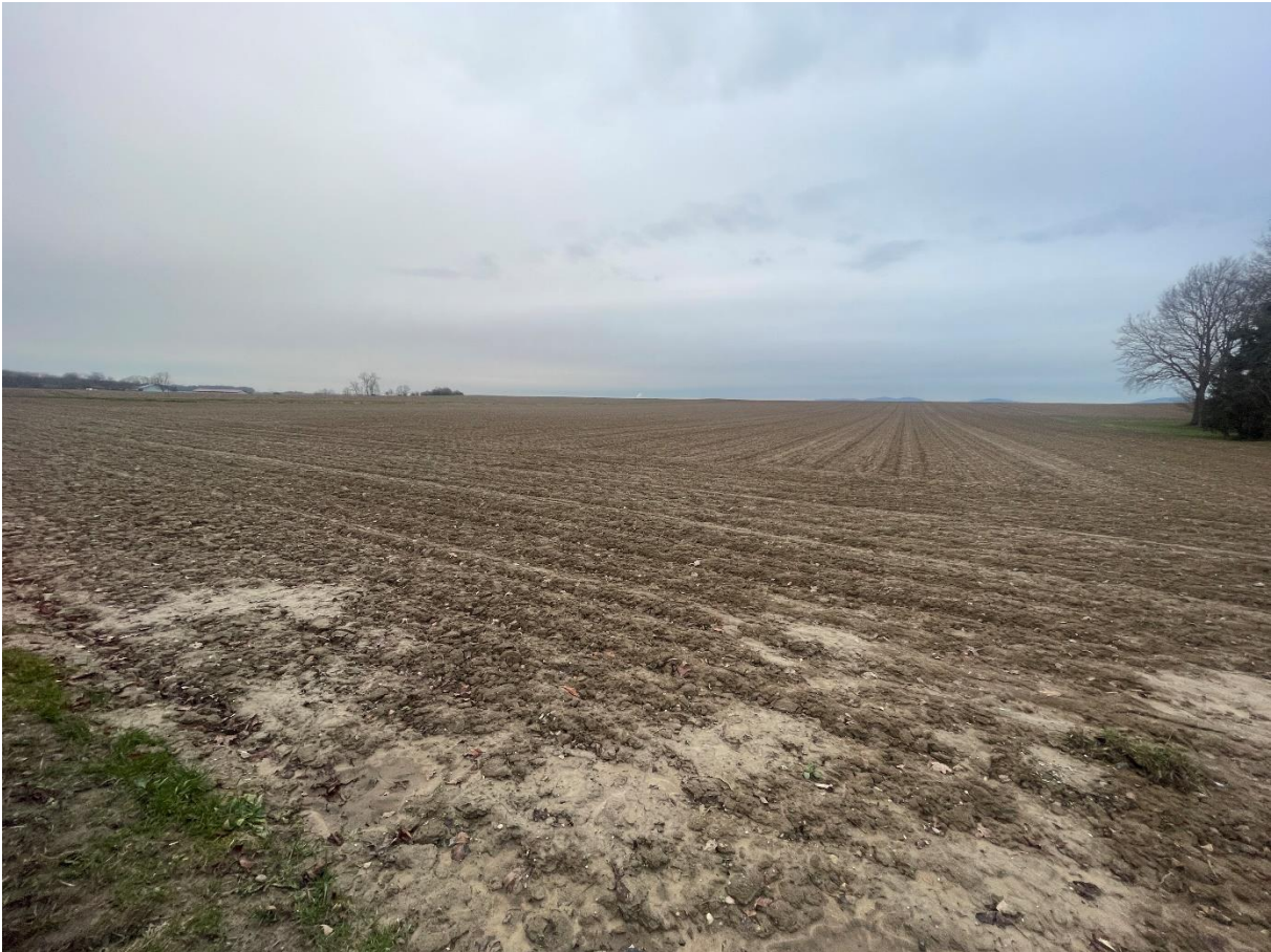
Abbildung 4: Blick in Richtung Nord-Westen