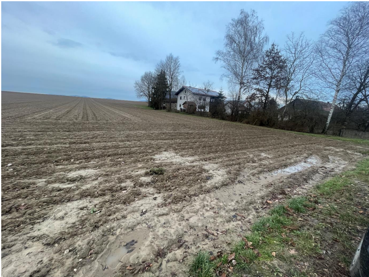
Abbildung 3: Blick in Richtung Nord-Osten

Der Änderungsbereich liegt rund 4,5 km Luftlinie nord-westlich des Stadtzentrums von Osterhofen im Bereich des Ortsteils Haid. Die Flächen werden über die Gemeindeverbindungsstraße Wisselsing – Ottmaring/Nindorf erschlossen. Der Änderungsbereich wird aktuell intensiv landwirtschaftlich bewirtschaftet.