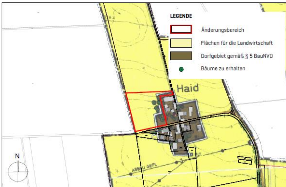
Abbildung 1: Ausschnitt derzeit rechtsgültiger Flächennutzungsplan

Auf der genannten Grundstücksfläche wird die Errichtung einer Agri-Photovoltaikanlage mit einer Gesamtleistung von 350 kWp vorgesehen.