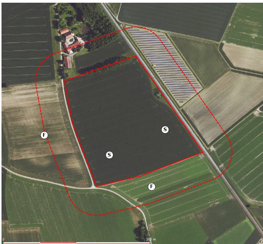
Abbildung 5: Lage der Revierzentren von Feldlerche (F) und Schafstelze (S), rote Linien: Flächen des geplanten Solarparks Lahnhof, rot gestrichelt: 100-Meter Puffer, Hintergrund Quelle: https://geoportal.bayern.de/bayernatlas/ )