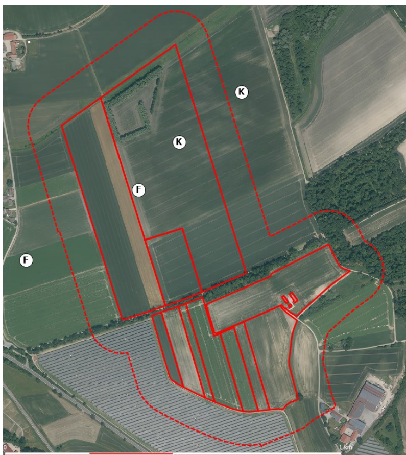
Abbildung 1: Lage der Revierzentren von Feldlerche (F) und Kiebitz (K), rote Linien: Flächen des geplanten Solarparks Burgstall West II, rot gestrichelt: 100-Meter Puffer, Hintergrund