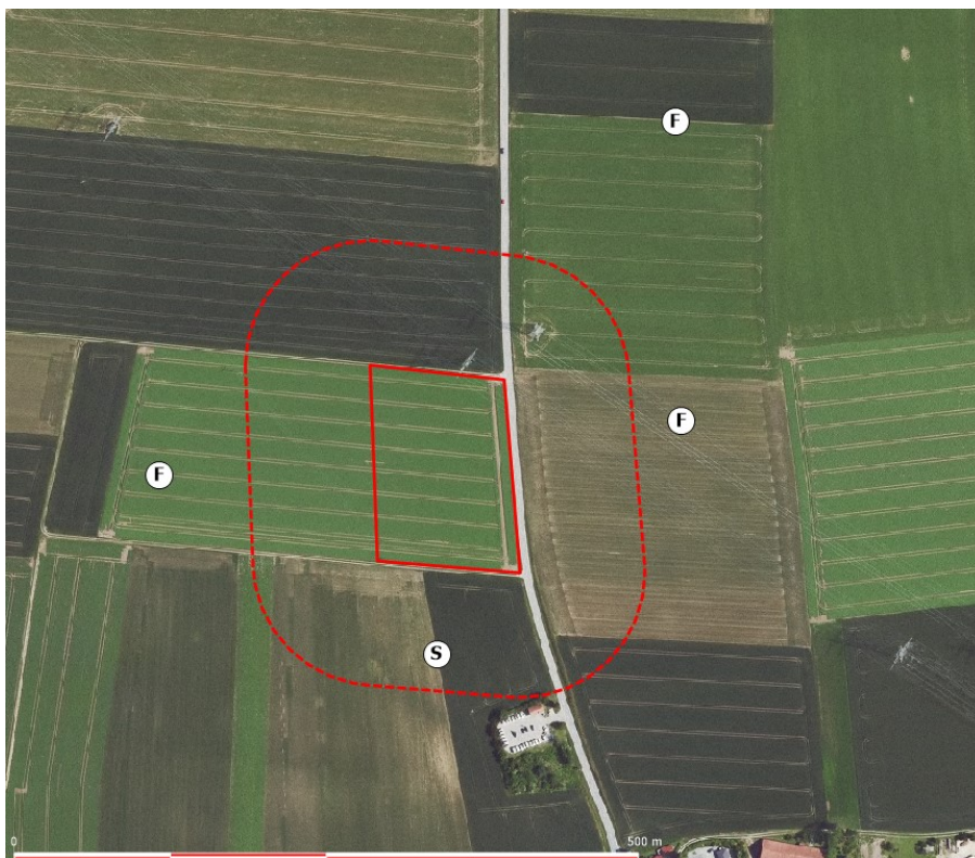
Abbildung 6: Lage der Revierzentren von Feldlerche (F) und Schafstelze (S), rote Linie: Grenzen des Vorhabensbereiches – Umspannwerk Buchhofen und Sondergebiet mit Zweckbestimmung Speicher mit Wasserstoffproduktion, rot gestrichelt: 100-Meter Puffer, Hintergrund Quelle: https://geoportal.bayern.de/bayernatlas/ )