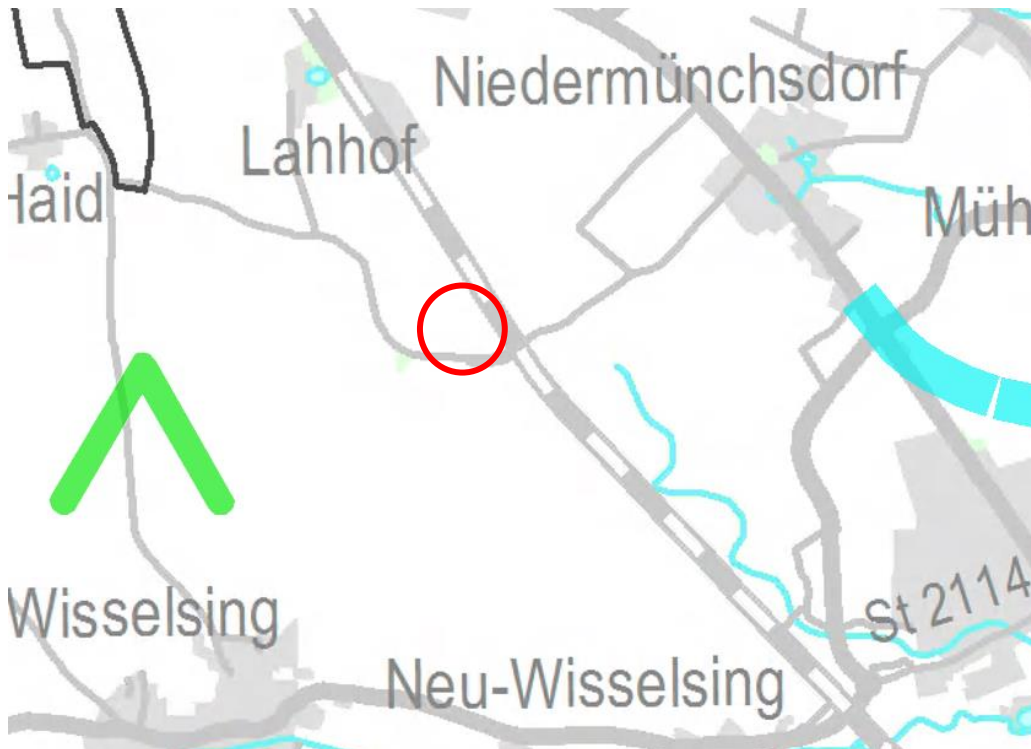
Auszug Ziele des Regionalplans Donau-Wald (nicht maßstäblich, Quelle RISBY, Stand 05/2019)

Laut Karte der Raumstruktur des Planungsverbandes Donau-Wald befindet sich das Bearbeitungsgebiet im Allgemeinen ländlichen Raum. Der Geltungsbereich befindet sich ca. 1,3 km nordwestlich von Osterhofen das als mögliches Mittelzentrum im Regionalplan der Region Donau-Wald gekennzeichnet ist. Außerdem verläuft hier die Entwicklungsachse Straubing - Passau. Für die beplanten Flächen sieht der Regionalplan keine besonderen Ziele und Maßnahmen vor. Im Osten befindet sich die Verkehrslinie zur Ortsumgehung von Osterhofen der Bundesstraße 8, westlich ist eine Landschaftspflegerische Maßnahme (Flurdurchgrünung) dargestellt.